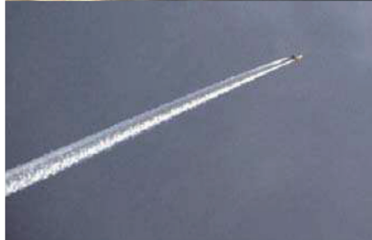
Die künstliche Wolken (sog. Chemtrails) werden von Flugzeugen ausgebracht.

Durch das Ausbringen von metallischen Feinstäuben entsteht eine künstliche Wolkendecke, die einem flächendeckenden Smog ähnelt.