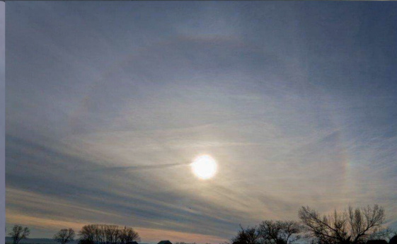
Durch die künstlichen Partikel kommt es häufig zu Halo-Erscheinungen und Verfärbungen am Himmel.