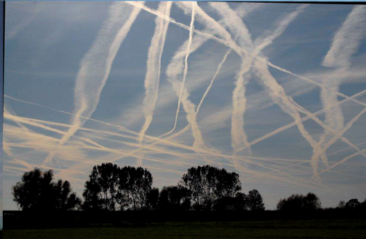
Mit Feinstäuben angereicherte Kondensstreifen breiten sich langsam zu einer Wolkendecke aus.