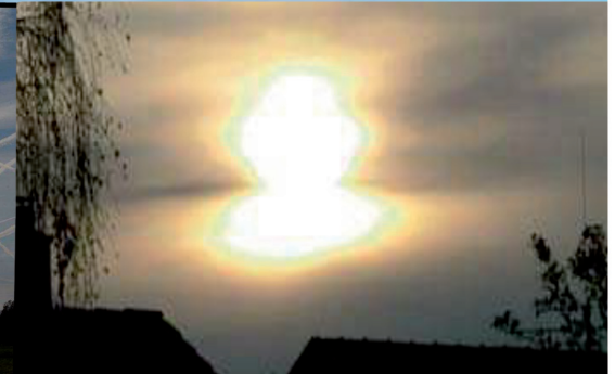
In den ausgebrachten Metallpartikeln spiegelt sich die Sonne wie auf einer Wasseroberfläche.